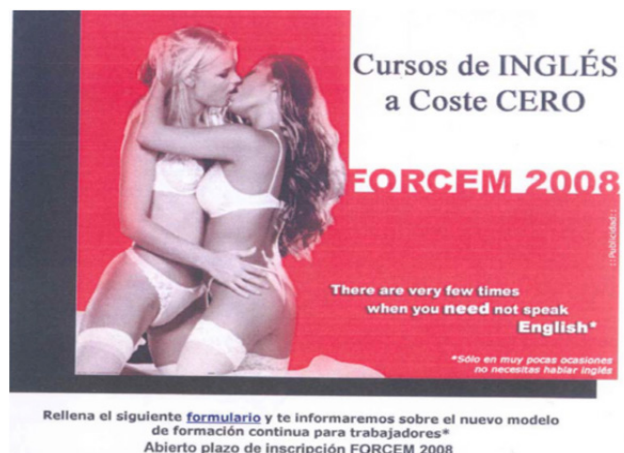
Imagen 7. Anuncio publicitario en internet de Forcem “Cursos de inglés a coste cero”