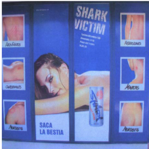
Imagen 5. Campaña de bebida energética Shark “Saca la bestia”