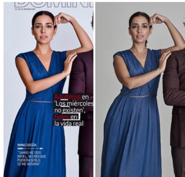
Imagen 1. Fotografía original de actriz Inma Cuesta (derecha) y retocada (izquierda)