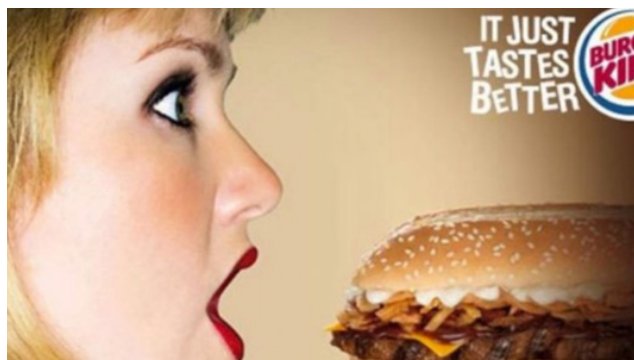
Imagen 8. Modelo en gesto explícito no consentido